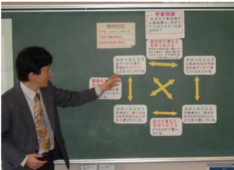
板書の様子(六合村立第一小学校)