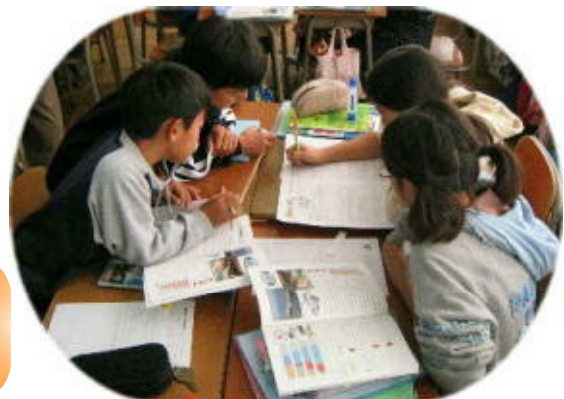
発表用の資料を作る様子(伊勢崎市立豊受小学校) 一人一人が調べ、まとめたものを、発表用の資料として一枚の用紙にはりあわせ、最後にグループとしてどんなことが分かったかについてまとめた。