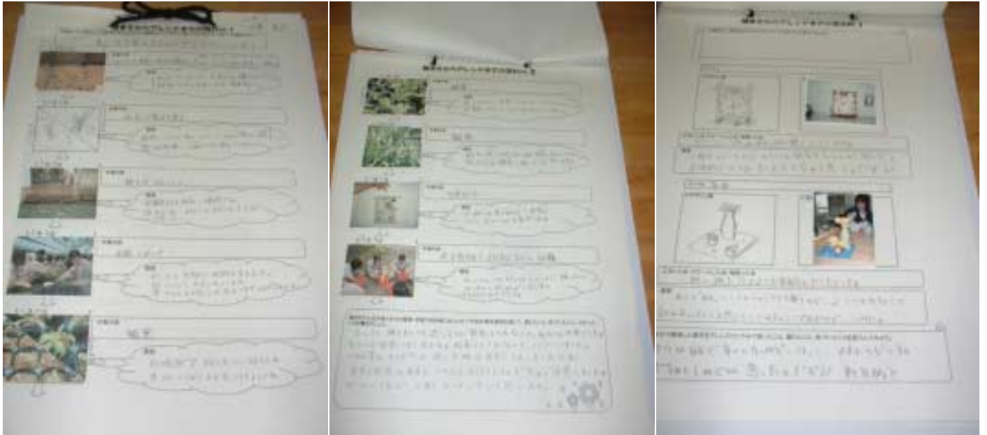
左より振り返りワークシートNo1.2.3

No.3…栽培した草花をどのように作品に生かし、生活へ取り入れていくかを考えさせる。