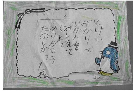
温かな人間関係づくり「異学年交流〔里の子活動〕」の情報の発信資料 「清里小だより」

ありがとうのカード・・・1年生より 時間を教えてくれてありがとう。 優しくしてくれてありがとう。 一緒に遊んでくれてありがとう。 ころんだときに「だいじょうぶ？」と言ってく れてありがとう。 行きたい動物に連れて行ってくれてありがとう。 どんぐりを拾ってくれてありがとう。 きれいなはっぱをひろってくれてありがとう。