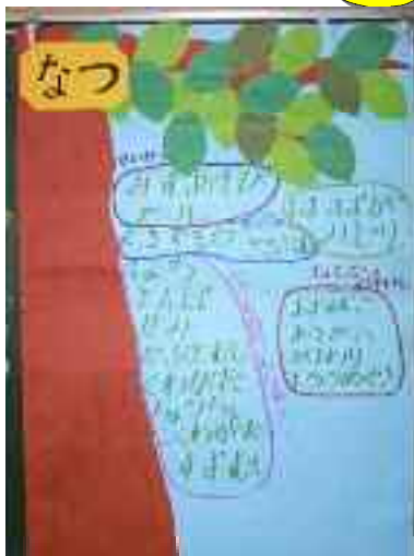
夏の振り返り(掲示物)