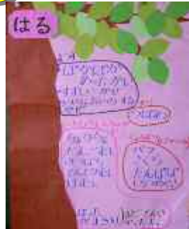
春の振り返り(掲示物)