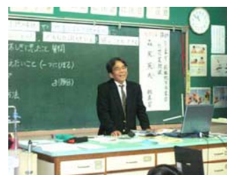
専門家が加わった授業

本校周辺は、市街地に近く住宅の多い地域である。平坦な土地が多く、児童が直接露頭を観察できるような場所はほとんど見あたらない。本校6年（児童 102 人）の本単元にかかわる実態を事前調査の中から次のようにとらえた。4分の3の児童が、崖やしま模様（地層）のある露頭について、「知らない」「見たことがない」と答えている。また、大地は、水のはたらきや火山の噴火のはたらきによって、形が変わることを知っているとして7割の児童が答えている。また、6割の児童が昨年10月に起きた、新潟県中越地震などの大きな災害について関心があると答えている。その他、火山や地震における興味関心の深い言葉やできごとについては、津波（5割弱）、地震（4割）阪神淡路大地震（4割弱）、火山噴火、溶岩、マグマ（ともに3割程度）という実態がある。