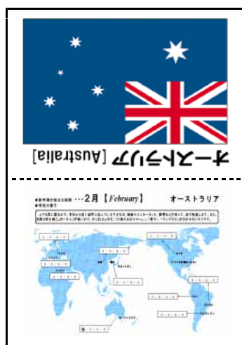
㊦ (ワークシートの表側)