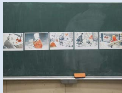
↑挿絵を使ったあらすじと作品構成の理解