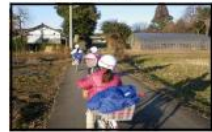
↑荷物を載せて 一列で通学