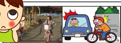
↑自転車通学する↑事故になりそう 2名の児童 な場面