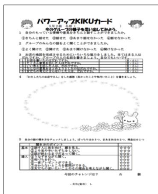
パワーアップKIKUカード①